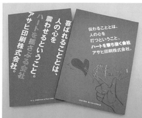
「メディア戦略企業」の思いと製品を伝える案内書